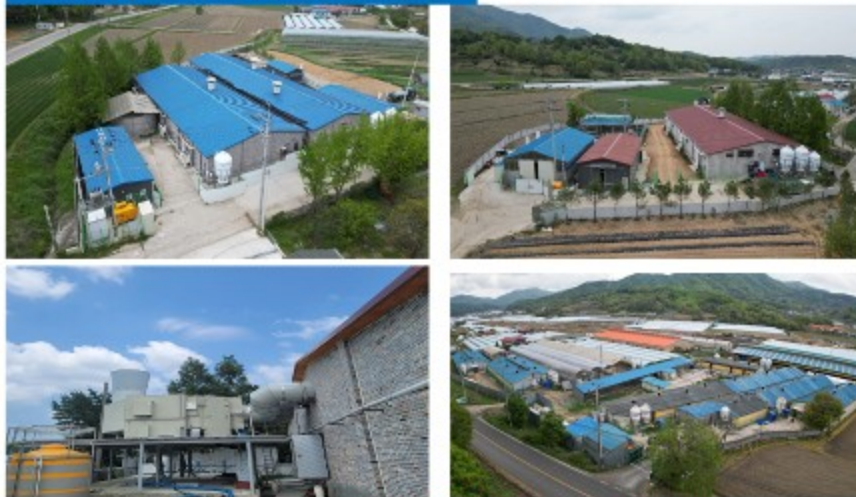
별빛축산, 여명농장 - 모돈 350두 2site