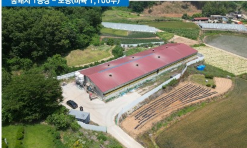
꿈돼지 1농장 - 보령(비육 1,100두)