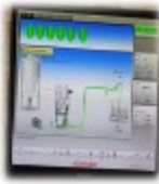
자돈사 : 액상 급이기