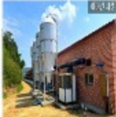
전 돈사 냉방 설비