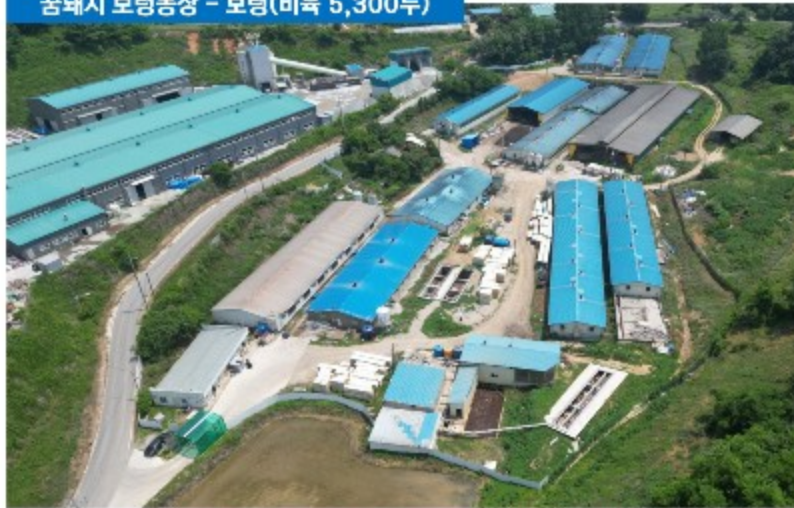
꿈돼지 보령농장 - 보령(비육 5,300두)