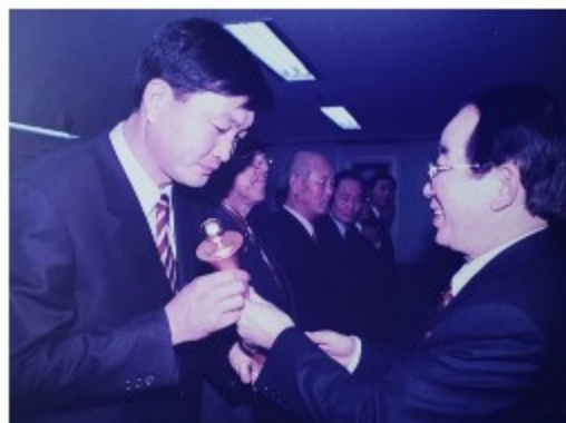
농림축산물 수출탑 수상 1999. 12. 21