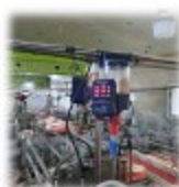
포유모돈 자동 급이기