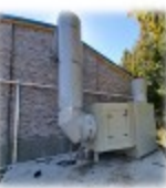
악취 제거 시설