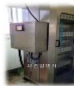
방류수 오존 살균