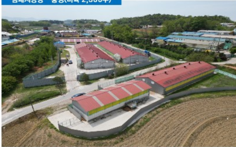
꿈돼지농장 - 홍성(비육 2,300두)